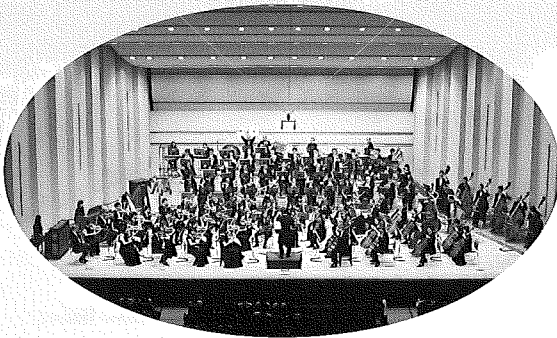
NPO法人 静岡フィルハーモニー管弦楽団

1977年9月に静岡市を中心とする音楽愛好家が集まって創立され、定期演奏会を軸に年3-5回の演奏活動を行っています。これまでの延べ公演回数は180回を超え、この間、1986年8月の中国公演（北京音楽庁、杭州劇院）を皮切りに、1989年米国（オマハ、ボストン）、1992年欧州（カンヌ、ウィーン）、2001年英国（バーミンガム、ロンドン）、2007年英国（コベントリー、ロンドン）、2012年8月中国（杭州）で公演、また2015年9月には米国ネブラスカ州にて静岡市オマハ市姉妹都市50周年記念演奏会を開催するなどの海外親善公演も成功させています。創立以来、国内外で活躍する指揮者やソリストとの共演を積み重ね、常に質の高い音楽作りを目指してきた一方、地域の合唱団、バレエ団等との本格的なオペラやバレエの公演も数多く行っています。また地域貢献活動として様々な施設に音楽を届ける「音楽の花束」事業も積極的に展開しています。1987年度静岡県文化奨励賞受賞。